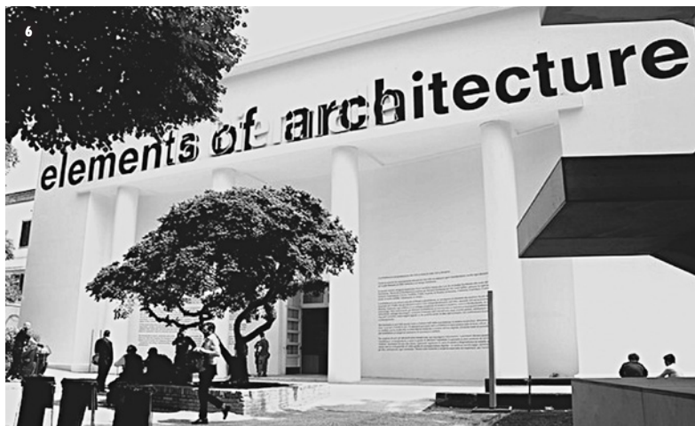
6. "Elements", Bienal de Venecia, 2014.

La primera de ellas, "Elementos de Arquitectura" (FIGURA 6), consiste en una revisión retrospectiva de los elementos fundamentales que han configurado la arquitectura a lo largo de los tiempos en todo el mundo: suelo, muro, cubierta, ventana, puerta, fachada, balcón, pasillo, chimenea, baño, escalera, ascensor, rampa, etc. En realidad, se trata del resultado de dos años de trabajo del grupo de investigación de Rem Koolhaas en la Harvard Graduate School of Design, en colaboración con un grupo de expertos de la industria y el ámbito académico (FIGURA 7).