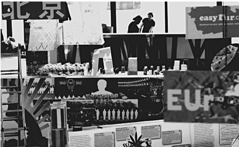
4. Contaminación visual en "Content", Neue National Galerie, Berlín, 2003.