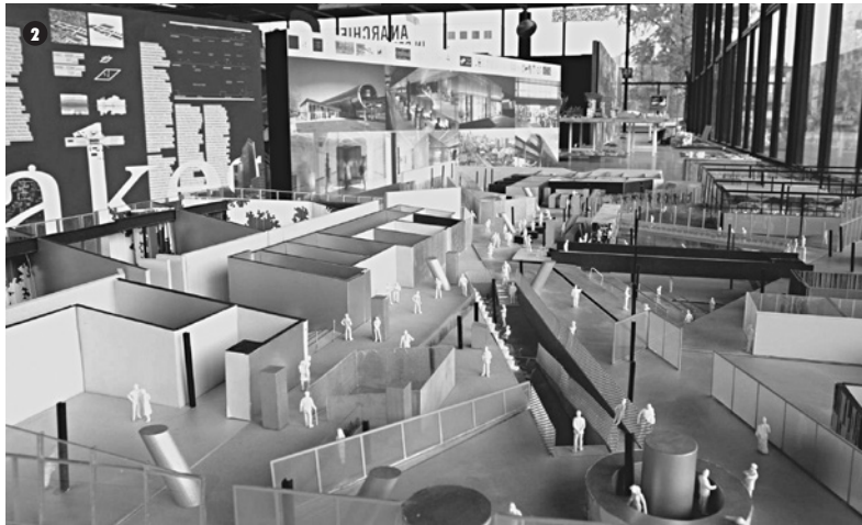
2. Fotografía de maqueta de "Content", Neue NationalGalerie, Berlín, 2003.