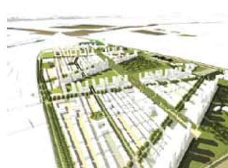
Serex de la Universidad Católica.