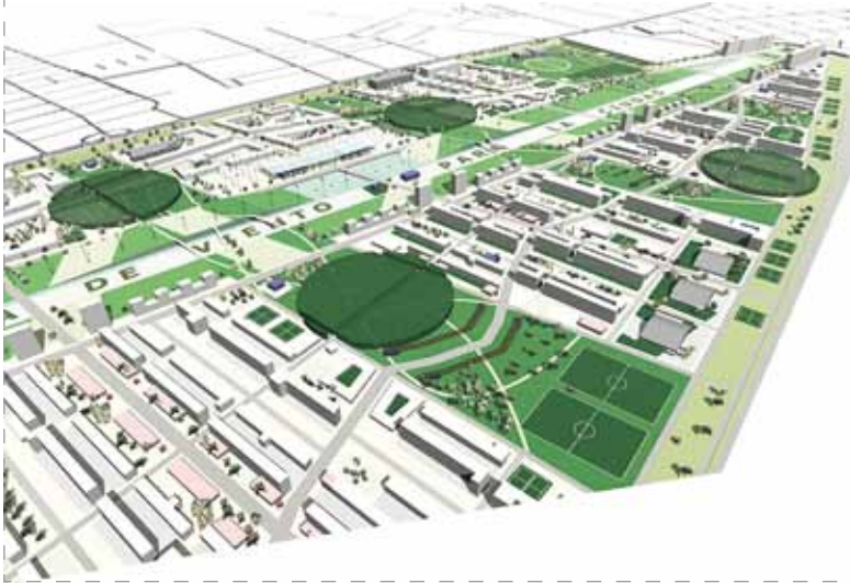
Proyecto ganador Concurso de Ideas.